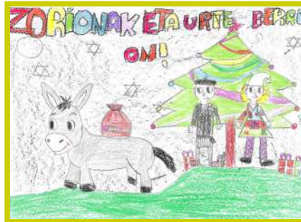
OIER AYERDI 9 eta 12 urte artekoen kategoria.

Los premios se han entregado el día 24 durante la recepción a Olentzero y Mari Domingi.