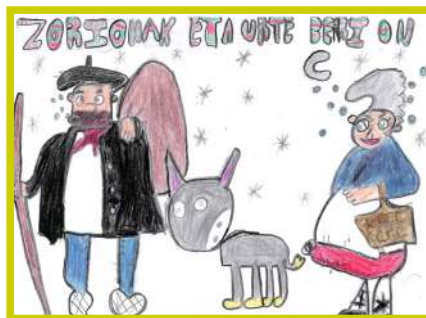
ARAIA ESCUZA 6 eta 8 urte artekoen kategoria.