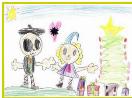
IRATI AYERDI 2 eta 5 urte artekoen kategoria.